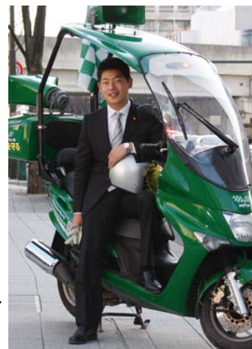
街宣バイク「ケンタ号」と

自民党がしっかりしないと、永住外国人への参政権付与のような危険な政策に追い風となるのだから。