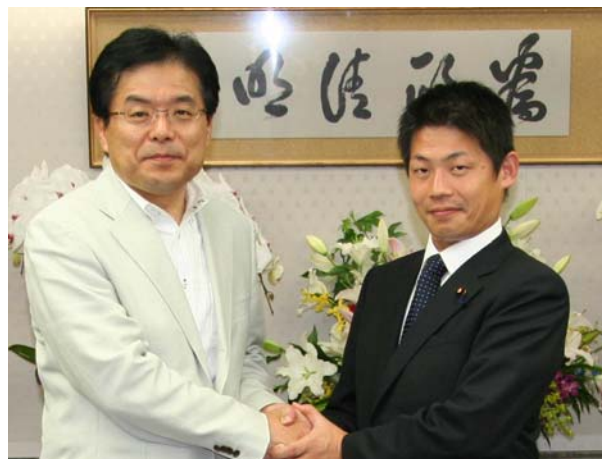
増田寛也・総務大臣兼内閣府道州制特命担当大臣とともに総務省の大臣室で

【地方分権・道州制】 は増田大臣の担当であり、私のもっとも得意とする分野です。国の出先機関の都道府県への移譲が地方分権のテーマとして浮上しています。しかし私は道州制とセットで行わなければうまくいかないのではないかと、危惧しています。